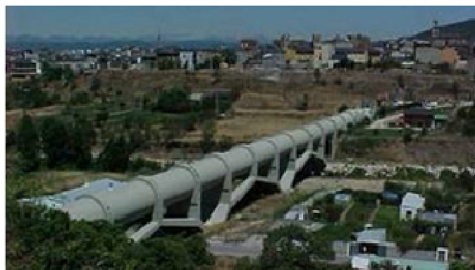
Figure 1. Example of pipe-bridge / Esempio di ponte-tubo.

Ponti tubo : sono costituiti da una tubazione in calcestruzzo armato o calcestruzzo armato pre-compresso o in acciaio sostenuta da un ponte, generalmente ad arco, in calcestruzzo armato o, più raramente, in acciaio. Come i ponti canale anche i ponti tubo sono normalmente dotati di giunti di dilatazione per assorbire le deformazioni dovute sia alla loro esposizione esterna che alla presenza o meno di acqua all'interno, la cui temperatura può essere molto diversa da quella ambiente.