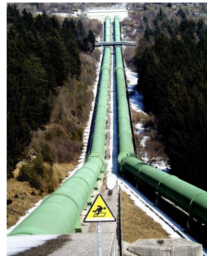
Figure 3. Example of Penstocks / Esempio di condotte forzate.

Per condotta forzata si intende il complesso delle tubazioni di collegamento tra la vasca di carico o il pozzo piezometrico dell'impianto e il macchinario idraulico. Tali tubazioni costituiscono l'adduzione secondaria fra l'ultimo elemento a pelo libero dell'impianto (organo di disconnessione) e l'utilizzazione (ad es. le turbine idrauliche). Sono tubazioni in pressione, di sezione circolare. Il loro diametro è commisurato alla portata, in modo che la velocità dell'acqua abbia un valore generalmente compreso tra 4÷6 m/s. Le condotte possono essere posate "all'aperto" o "in sotterraneo".