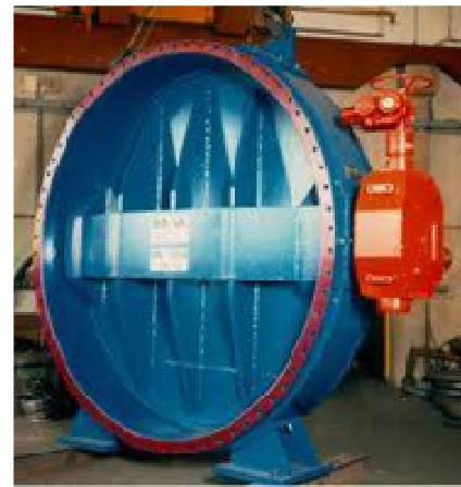
Figure 4. Example of butterfly valve / Esempio di valvola a farfalla.

Valvole a fuso: l'organo otturatore di questo tipo di valvola ha la forma di un fuso che viene spostato in direzione assiale per le manovre di chiusura o apertura.